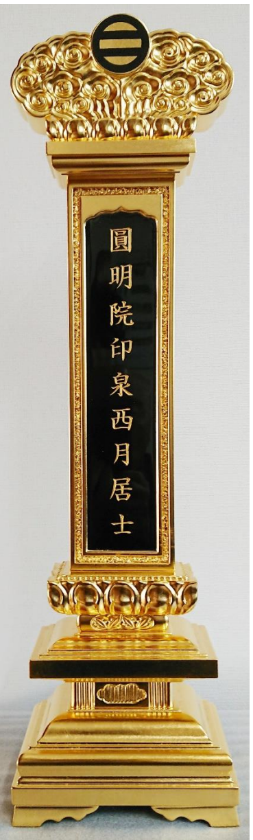
妙心寺型位牌 高さ 六〇cm