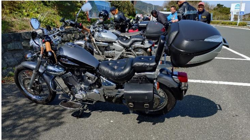
↑ ホンダ Magna 250