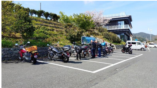
佐田岬半島ミュージアム