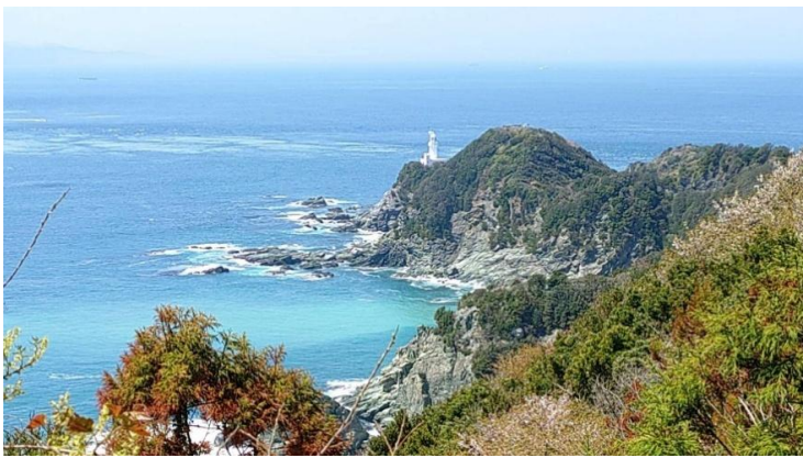
展望台から見た佐田岬の灯台

往路は、夕やけこやけライン 復路は、大洲市内で ソフトクリーム休憩 走行距離は、318kmでした。